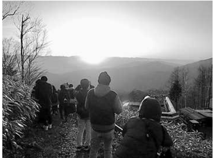
青年学習交流ツアー 長野県阿智村

私が組合員でいることは、今困っている誰かの役に立っていることです。働く人は本当に弱いし、助け合いですから、誰もが組合の一員でいるのが自然なことではないでしょうか。(事務職・女性・40代)