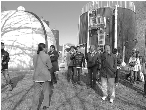
再生可能エネルギー学習ツアー 岩手県・葛巻町

組合で主催された環境問題を考える見学ツアー(再生可能エネルギーを活用したまちづくり)に参加しました。地球環境問題に関心があって、大学でも専攻していました。現在の所属は環境の部署ではありませんが、将来必ず役に立つとても貴重な経験でした。今後できたら自分でも組合のツアーを企画・実施したいです。同じ関心を持つ県内の職員の方々となつなかりが持てればと考えています。(事務職・男性・30代)